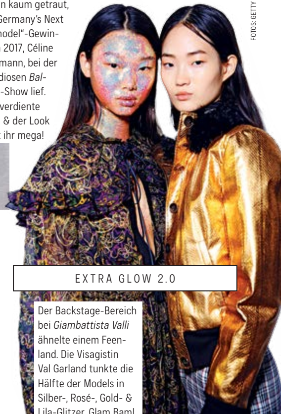
EXTRA GLOW 2.0

Der Backstage-Bereich bei Giambattista Valli ähnelte einem Feenland. Die Visagistin Val Garland tunkte die Hälfte der Models in Silber-, Rosé-, Gold- & Lila-Glitzer. Glam Bam!