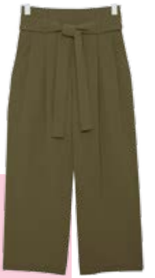
Von COS um € 79,-.

Hallo Paperbag-Trousers! Also wörtlich übersetzt: Hallo Papiertüten-Hosen! Der Name macht uns jedenfalls gute Laune! Und auch der Look überzeugt: 1. Sie müssen hochtailliert sein. 2. Der obere Rand über der Taille muss gerafft sein. Notfalls macht den Volant-Effekt ein enger (überlanger) Gürtel. 3. Sie haben einen lockeren, baggy Schnitt! Die besten Kombimöglichkeiten? Entweder ein Croptop (very sexy) oder ein enges, schmales Oberteil reinstecken. So lässig, so chic!