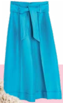
Von Uterqüe um € 125,-.