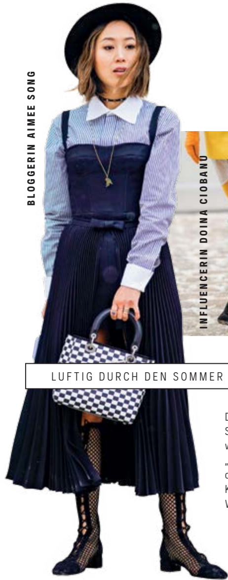
LUFTIG DURCH DEN SOMMER