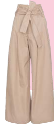
Von Wright Le Chapelain um € 692,-.