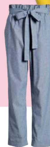
Von Nordstrom um € 42,20.