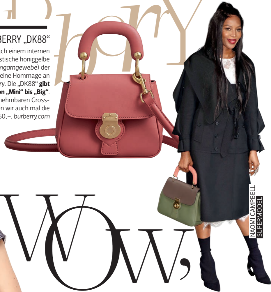
NAOMI CAMPBELL SUPERMODEL

Die „DK88“ wurde nach einem internen Code für die charakteristische honiggelbe Gabardine (Anm.: Kammgarngewebe) der Marke benannt und ist eine Hommage an die Wurzeln von Burberry. Die „DK88“ gibt es in vier Größen von „Mini“ bis „Big“. We love: Durch den abnehmbaren Crossbody-Riemen haben wir auch mal die Hand frei! :-)) Ab € 1.150,-. burberry.com