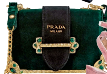
MINIBAG. „Cahier Box“ aus Samt von Prada um € 1.900,-