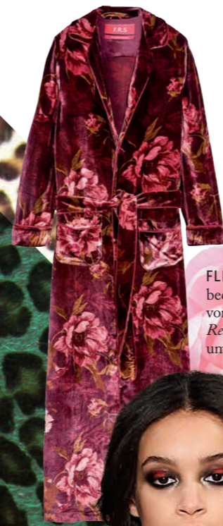
FLEUR. Mantel aus bedrucktem Samt von F.R.S For Restless Sleepers um € 2.025,-