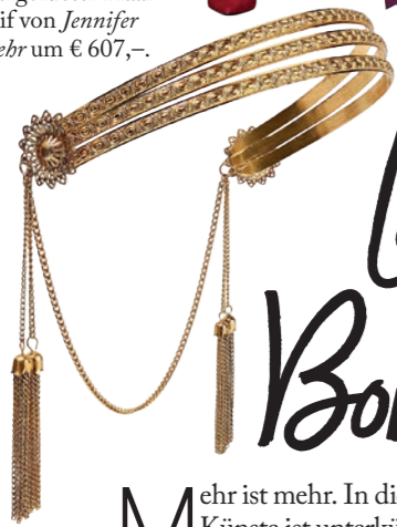
HAARSCHMUCK. Vergoldeter Haarreif von Jennifer Bebr um € 607,-