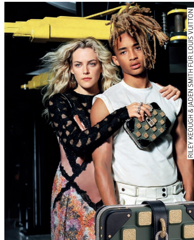
RILEY KEOUGH & JADEN SMITH FÜR LOUIS VUITTON