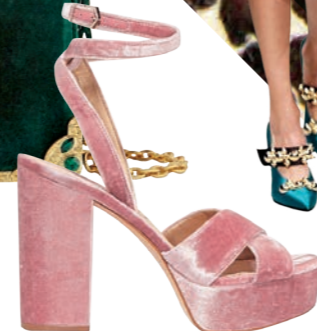
PLATEAU. Von Sam Edelman um € 150,-