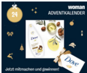
Mobile Content Ad (Symbolbild)