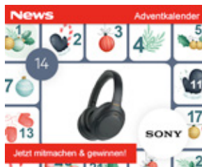
Mobile Content Ad (Symbolbild)