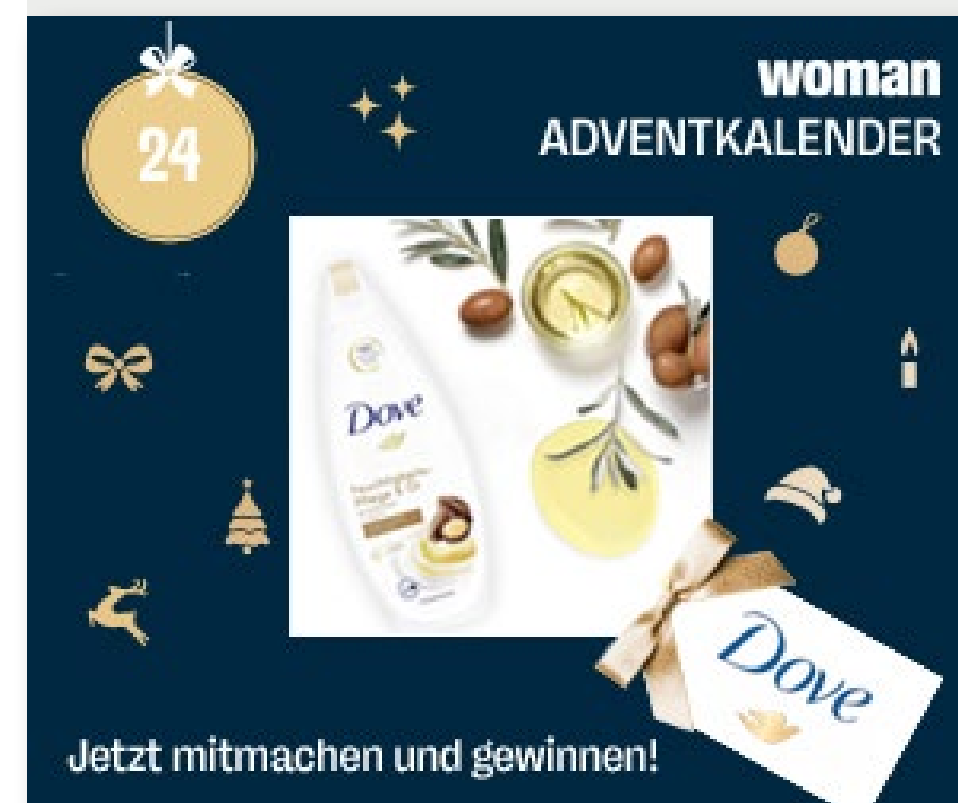
Mobile Content Ad (Symbolbild)