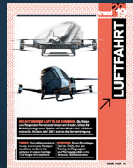
1/1 Seite Intro