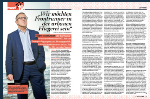
2/1 Seite Interview