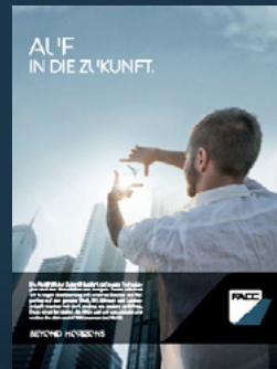
1/1 Seite Inserat