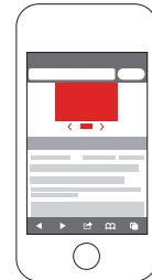
Slideshow Ad (300 x 250 px, max. 40 kB pro Slide)