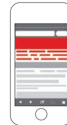
Advertorial Teaser (300 x 250 px, max. 40 kB)