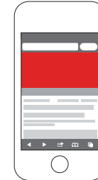
Mobile Content Ad (300 x 250 px, max. 40 kB, HTML5)