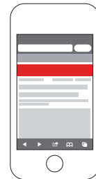
MMA Banner (300 x 50 px, 40 kB)