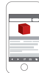
Cube Ad (320 x 320 px, max. 200 kB – für alle 4 Seiten insgesamt)